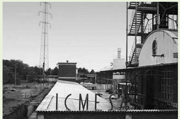
La fabbrica chimica ICMESA nel 1976

Qui inoltre la questione è paradossale. Per consentire ai veicoli alte velocità, su di un tracciato classificato come autostradale e POTER QUINDI FAR PAGARE IL PEDAGGIO AI CITTADINI LOMBARDI, regione Lombardia ha derogato sul vincolo di inedificabilità del Bosco delle Querce, vincolo imposto in origine dalla stessa Regione Lombardia che si era assunta l'obbligo di preservare un MONUMENTO VIVENTE MONDIALE che rappresenta fisicamente il riscatto da un dramma che non va dimenticato e che ancora oggi segna gran parte della nostra terra di Brianza.