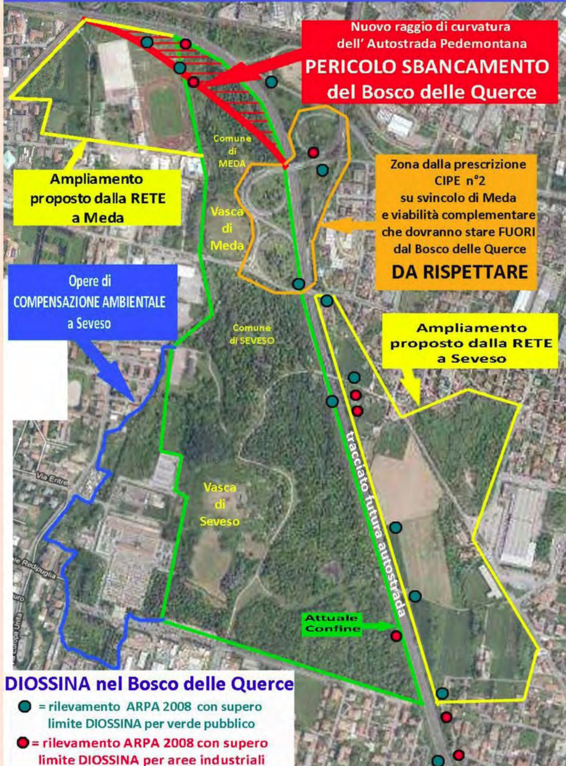
La mappa riassuntiva delle problematiche del Bosco delle Querce