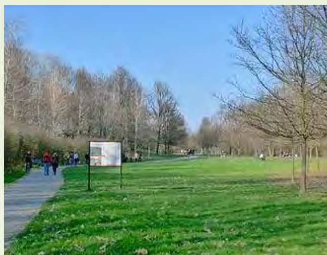
Un percorso nel Bosco delle Querce

Nulla di più falso. La parte medese del Bosco è accessibile e fruibile. Sicuramente necessita di un ponte sul torrente Tarò che dia continuità e ne migliori la fruibilità con la zona del Centro Sportivo, anch'esso nel perimetro del Parco Naturale Regionale. Siamo però ben lontani dall'aver una porzione di verde "residua", inesistente per la gente, così come alcuni tentano di spacciarla. INSIEME IN RETE PER UNO SVILUPPO SOSTENIBILE , sta lavorando anche in questa direzione.