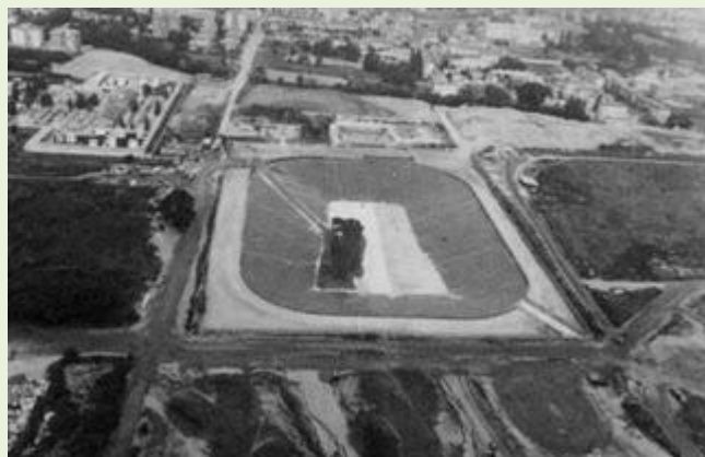
La vasca di Meda

Ma evidentemente è più facile derogare verso una via più semplice per denaro, con buona pace per le banche che finanziano l'opera e della politica che continua a privilegiare il trasporto su gomma rispetto a quello su ferro.