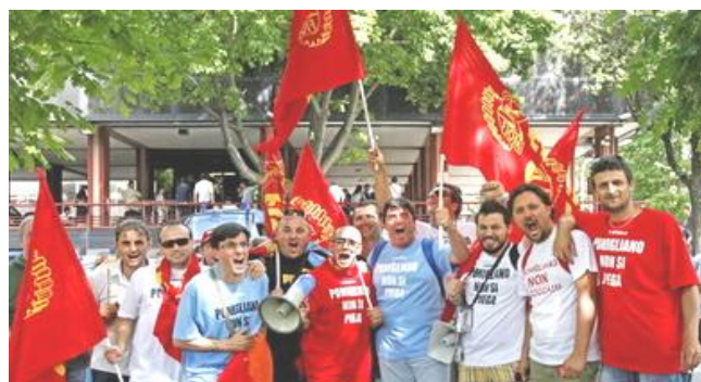
Lavoratori di Pomigliano

Un ritorno agli anni '50, al lavoro SENZA DIGNITA', alla DEMOCRAZIA che si FERMA FUORI DAI CANCELLI DELLA FABBRICA.