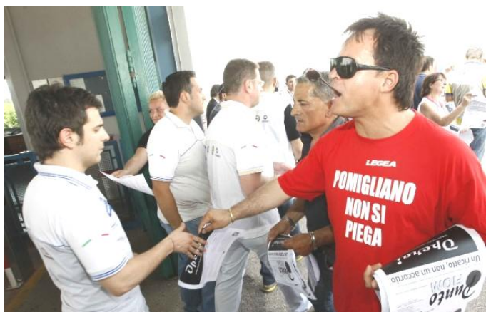
Volantinaggio FIOM a Pomigliano

E il Governo di destra e liberista che fa? Semplice, coglie la palla al balzo per tentare di mettere nell’angolo la FIOM, il SINDACATO PIU’ RAPPRESENTATIVO TRA I METALMECCANICI . Il suo compito, se di governo “super partes” si trattasse, sarebbe invece di RICHIAMARE Fiat e Confindustria AL RISPETTO DELLE LEGGI e DELLA COSTITUZIONE, chiedendo pure CONTO degli INCENTIVI e degli sgravi fiscali (quindi DENARO PUBBLICO) regalati all’industria privata .