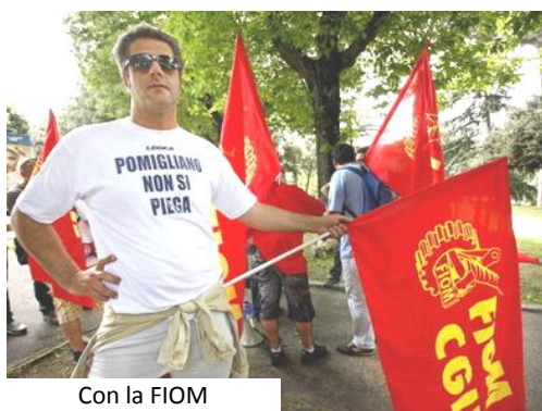
Con la FIOM

Per Fiat è un prendere o lasciare. Per Marchionne ciò che propone è l'occasione di rilancio su Pomigliano cui tutti dovrebbero essergli grati.