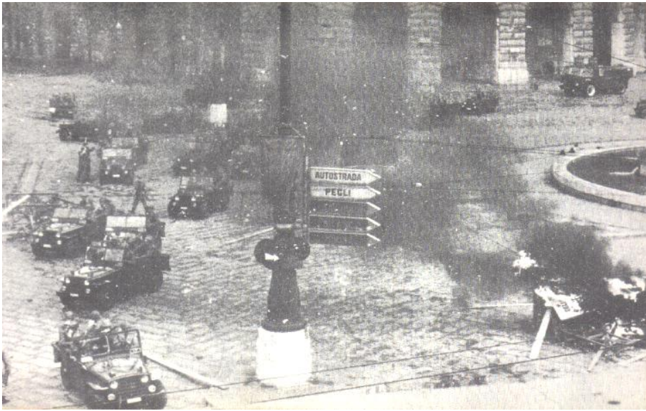
La polizia riprese in un momento del carosello, attorno alla vasca di piazza De Ferrari, mentre si apprestano a sparare, non solo candelotti lacrimogeni, contro gli antifascisti genovesi.