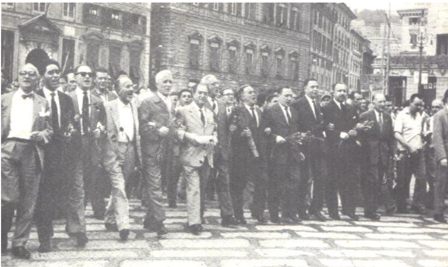
30 giugno 1960 - pomeriggio- In piazza De Ferrari sfila il corteo dei «centomila» guidato da dirigenti politici e comandanti partigiani.