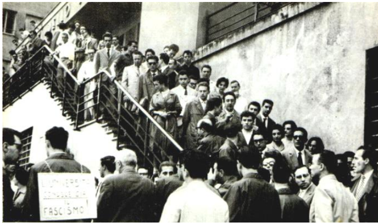
25/6/1960 Docenti e studenti manifestano alla Casa dello studente

18 FEBBRAIO 1963: Tambroni muore d'infarto a Roma.