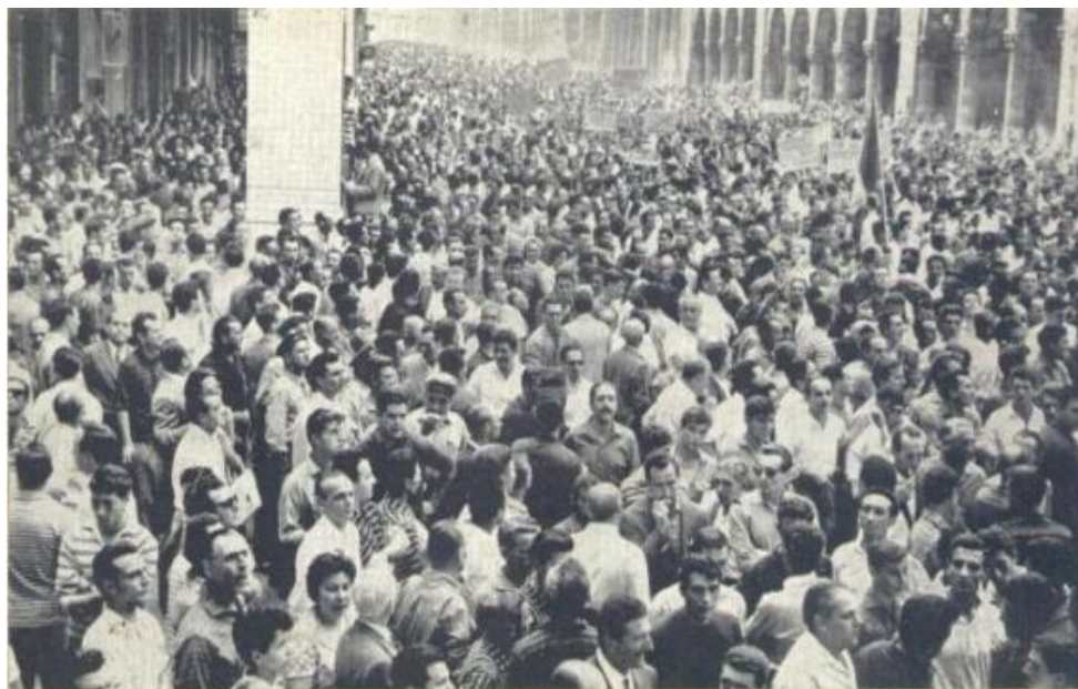
Genova, 30 giugno 1960 - I "centomila", manifestano contro il congresso del M. S. I. e rendono omaggio al Sacrario dei Caduti