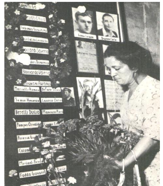
Una donna depone fiori al sacrario dei caduti partigiani.