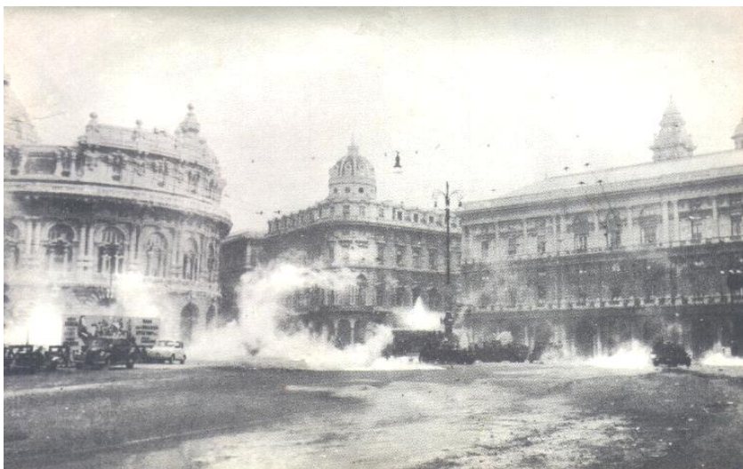
30 giugno 1960 - Piazza De Ferrari - La polizia dei reparti celere entra in azione.