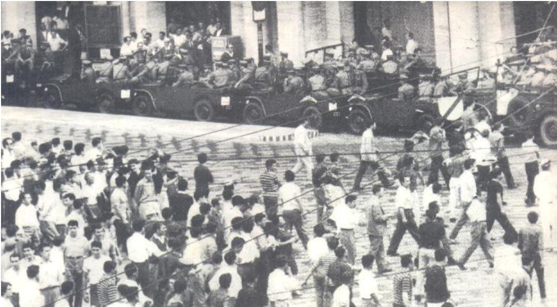
30 giugno - piazza De Ferrari- la folla dei manifestanti antifascisti si disperde: successivamente la polizia entrerà in azione ed esploderà la rabbia popolare. I giovani antifascisti e i partigiani risponderanno colpo su colpo alle provocazioni poliziesche ordinate dal ministro degli interni del governo Tambroni.