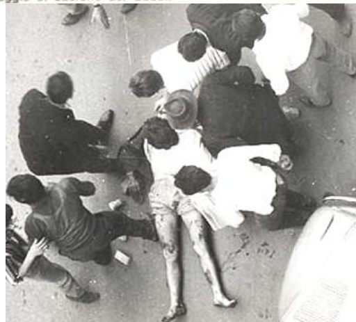
7 Luglio 60: uno dei 5 morti a Reggio Emilia dopo che la polizia ha sparato su una manifestazione

28 GIUGNO: Pertini tiene un comizio a cui partecipano trentamila persone.