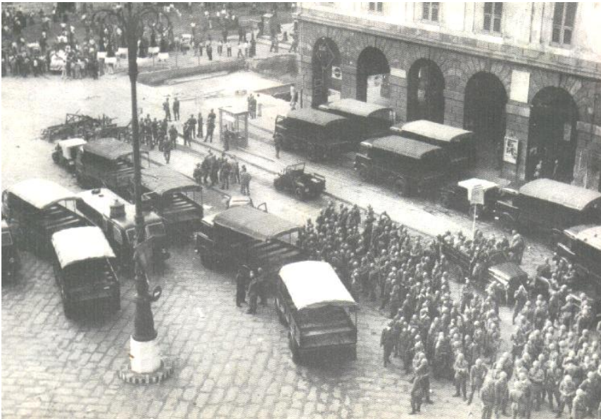
30 giugno 1960 - piazza De Ferrari - I reparti celere di Tambroni si preparano ad attaccare gli antifascisti.