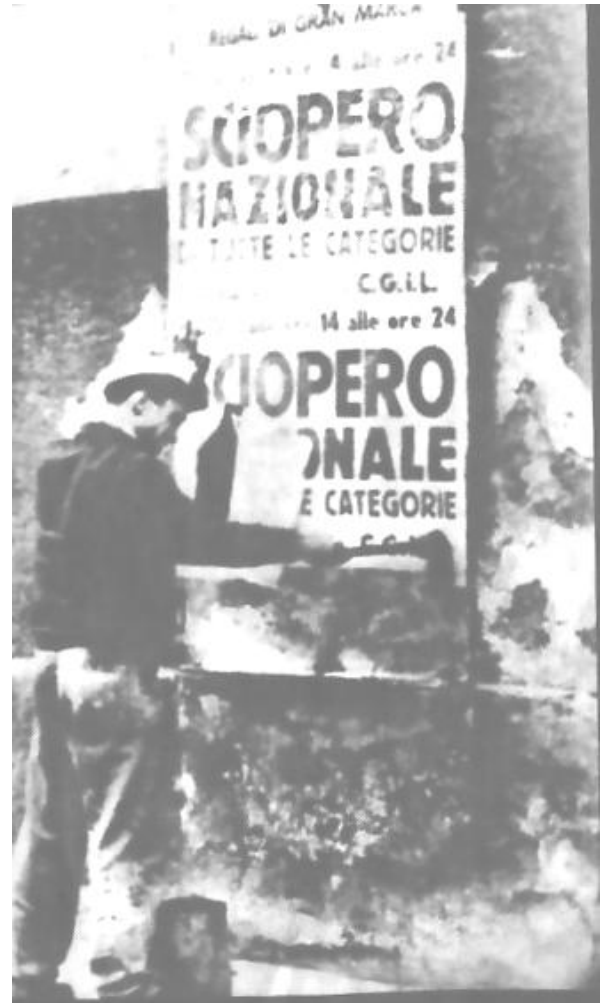
Sciopero Generale dopo i morti di Reggio Emilia