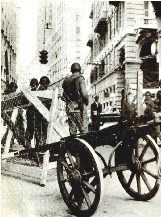
Posti di blocco della celere nel centro della città.