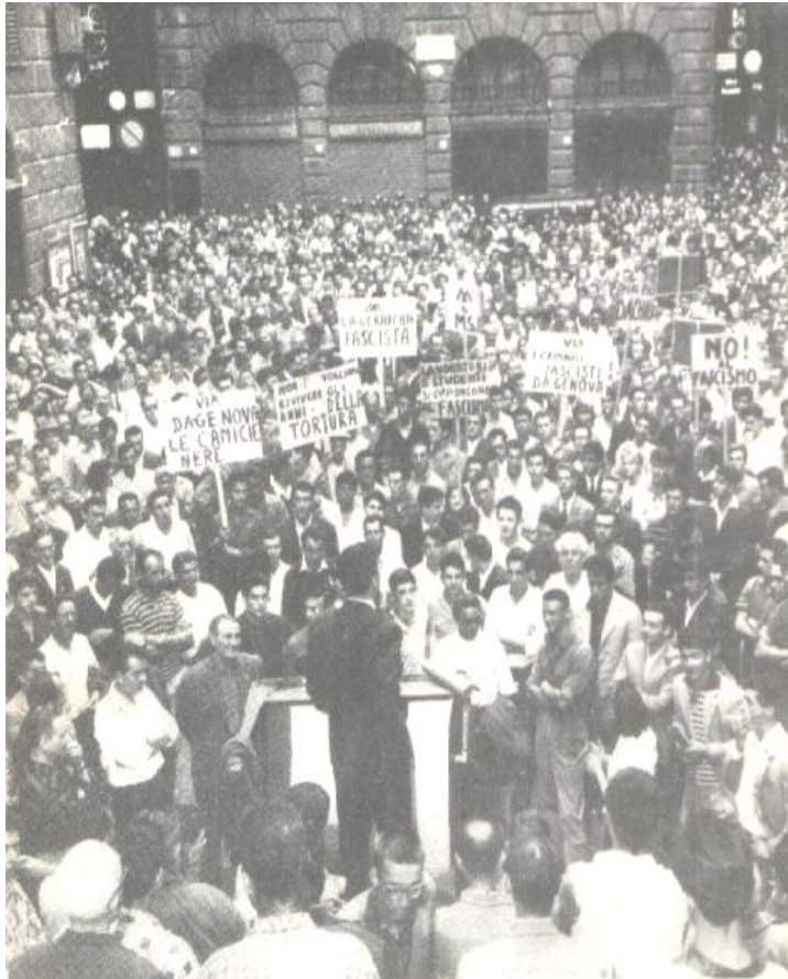
Genova: comizio dei movimenti giovanili