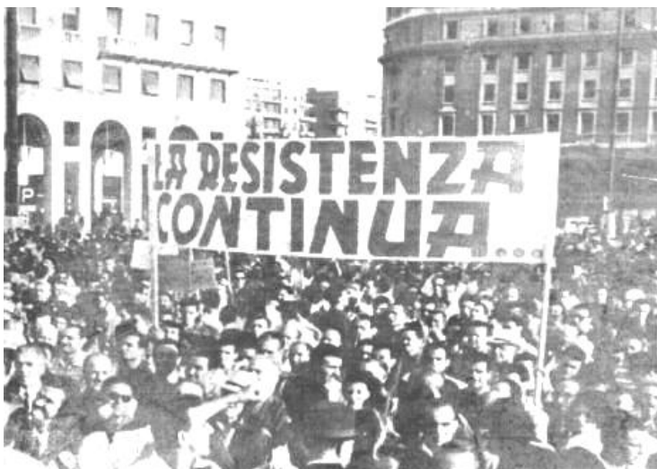
Fuggiti i fascisti da Genova, LA RESISTENZA CONTINUA