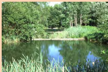
Le sorgenti del Terrò ad Inchigollo