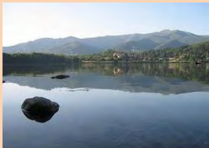
Il lago di Montorfano

a cura della Società Escursionisti Medesi e del CAI di Meda