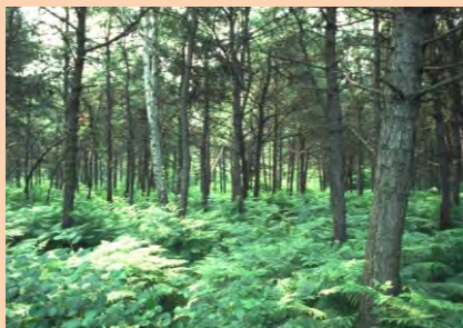
I boschi della brughiera