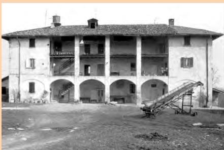
La cascina Mordina a Mariano nel 1950